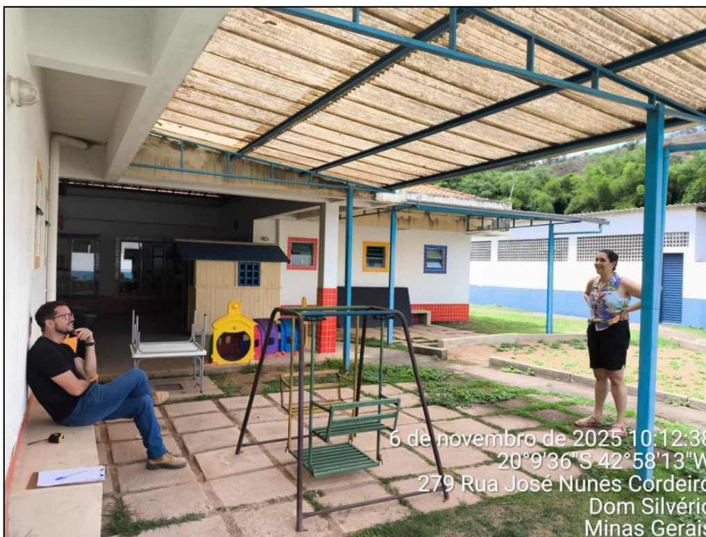
Foto 01- Local onde será construída a nova sala